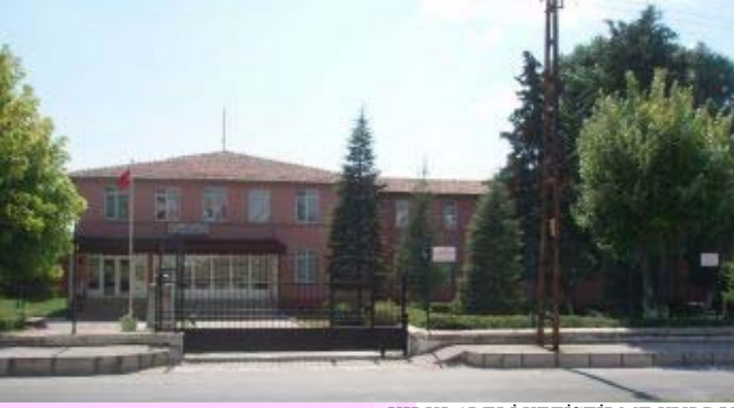
KIRKLARELİ YETİŞTİRME YURDU